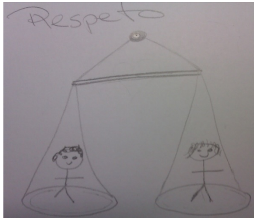
FIGURA 3. Ejemplo 3

FUENTE: Dibujo de una estudiante del Máster de Intervención Psicosocial. UAB.